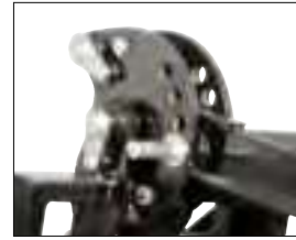
Ouverture du grappin ajustable.