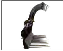
Grappin puissant à ouverture totale >90° permettant le travail contre les murs.