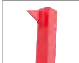
Dents de maintien sur le haut du châssis.