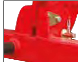
Dents baïonnettes repliables sans outils pour la circulation sur route.