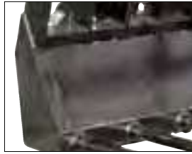
Structure massive et résistante.