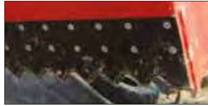
Dents de découpe boulonnées (excepté SHG 1700/850: dents soudées).