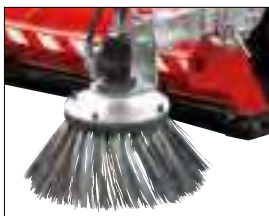
Brosse latérale en acier et polouiter.