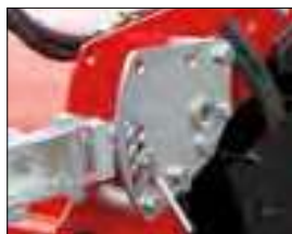
Brosse latérale interchangeable (côté gauche ou droit) pour un balayage parfait le long des murs et trottoirs.