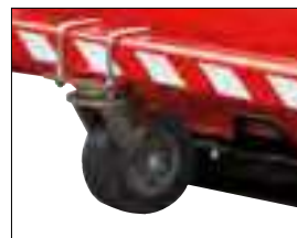
Roues renforcées pivotantes orientables pour une conduite facilitée.