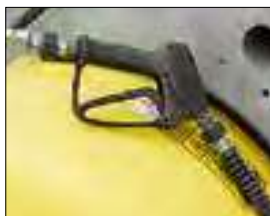
Lance de pulvérisation pour un nettoyage puissant et précis.